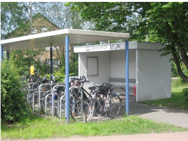
Die Fahrradabstellanlage und das Wartehäuschen