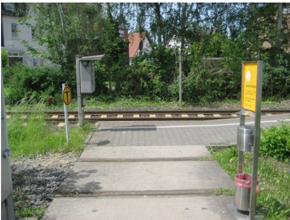
Der Zuweg zum Bahnsteig erfolgt über das ehemalige zweite Gleis