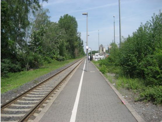
Bahnsteig in gutem Zustand, aber leider ohne Sitzgelegenheiten