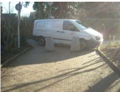
Selbst die S-Bahnmitarbeiter finden keinen Stellplatz und blockieren den Bahnhofszugang