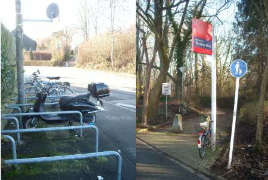
Unscheinbare Zugänge zu den Bahnsteigen