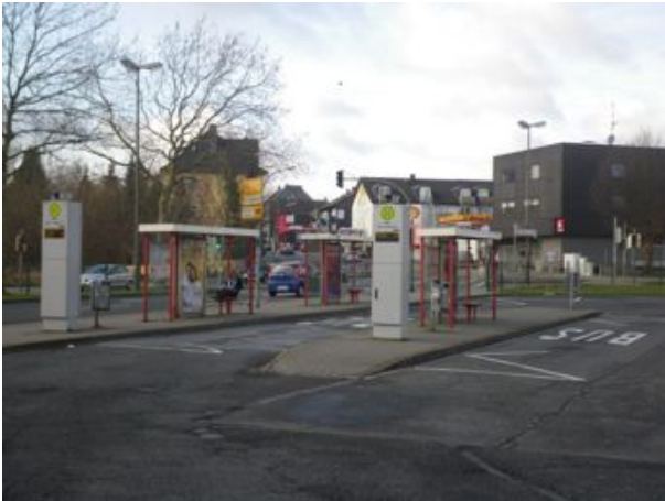
Direkte Verknüpfung zum Busverkehr, aber nicht barrierefrei