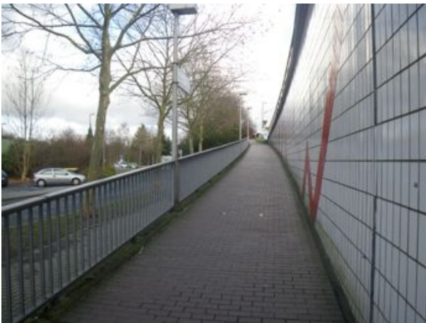
Barrierefreier Zugang, aber lange Rampen ohne Zwischenpodeste