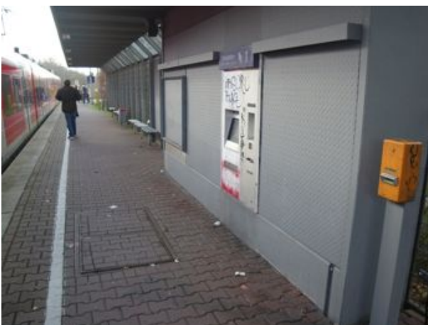
Funktionsfähiger Automat, aber fehlende weitere Aushänge und fehlender Fahrplan