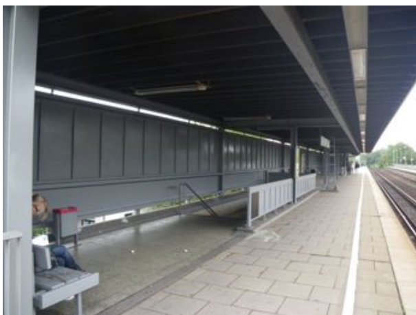
Insgesamt ein sauberes Erscheinungsbild auf dem Bahnsteig