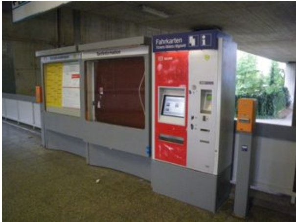
Alles Wesentliche vorhanden, aber noch Platz für Informationen zur Umgebung