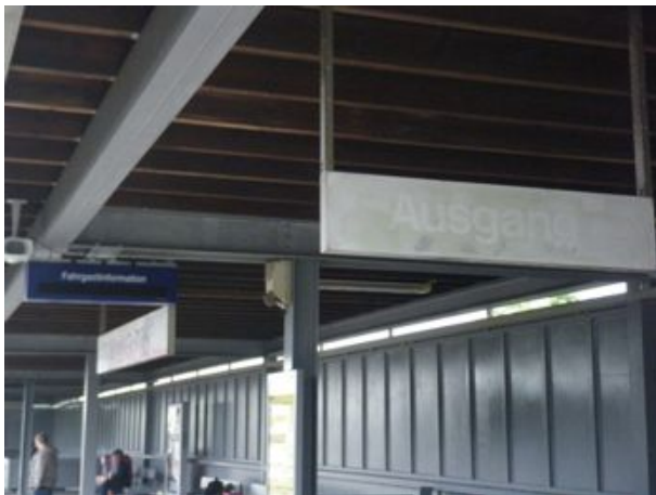
Schwer lesbare Schilder auf den Bahnsteigen und defekte Fahrgastinformation